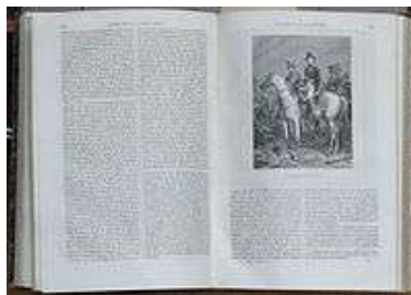
Fotografia de um livro publicado em 1866.