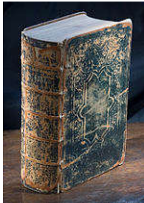
Uma antiga bíblia cristã feita em códex.

Uma consequência fundamental do códice é que ele faz com que se comece a pensar no livro como objeto, identificando definitivamente a obra com o livro.