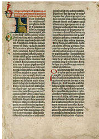
Uma página da Bíblia de Gutenberg (Velho testamento)

Na idade Média o livro sofre um pouco, na Europa, as consequências do excessivo fervor religioso, e passa a ser considerado em si como um objeto de salvação. A característica mais marcante da Idade Média é o surgimento dos monges copistas, homens dedicados em período integral a reproduzir as obras, herdeiros dos escribas egípcios ou dos librai romanos. Nos mosteiros era conservada a cultura da Antiguidade. Apareceram nessa época os textos didáticos, destinados à formação dos religiosos.