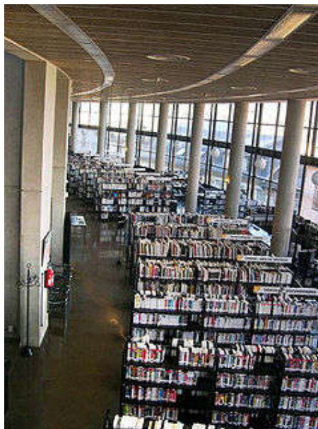
Biblioteca moderna em Chambéry, França

A criação do conteúdo de um livro pode ser realizada tanto por um autor sozinho quanto por uma equipe de colaboradores, pesquisadores, co-autores e ilustradores. Tendo o manuscrito terminado, inicia a busca de uma editora que se interesse pela publicação da obra (caso não tenha sido encomendada). O autor oferece ao editor os direitos de reprodução industrial do manuscrito, cabendo a ele a publicação do manuscrito em livro. As suas funções do editor são intelectuais e econômicas: deve selecionar um conteúdo de valor e que seja vendável em quantidade passível de gerar lucros ou mais-valias para a empresa. Modernamente o desinteresse de editores comerciais por obras de valor mas sem garantias de lucros tem sido compensado pela atuação de editoras universitárias (pelo menos no que tange a trabalhos científicos e artísticos).