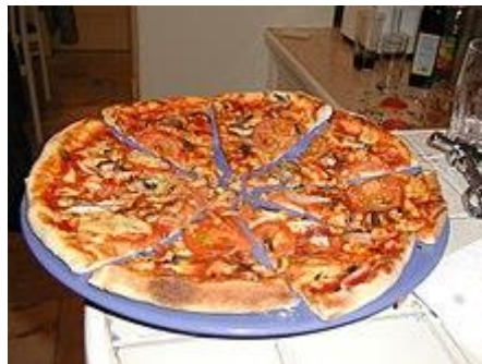
Uma pizza de queijo, tomate e aliche feita em casa

Especialmente na cidade brasileira de São Paulo, que tem uma grande colônia italiana, o consumo de pizzas é grande e sofisticado, com o ato de reunir-se numa pizzaria sendo frequentemente significado de celebração e acordo. Deste costume, surgiu a expressão, comumente usada no país, associando um processo que envolva ações de ética ou legalidade duvidosa a esta celebração. Quando apenas alguns dos envolvidos de menor importância são penalizados ou existe um movimento de acomodação, terminando em mesa de negociação, ou "terminando em pizza", como se as partes envolvidas, acusados e acusadores, se sentassem numa pizzaria e, apreciando a saborosa iguaria, celebrassem o acordo durante uma "rodada de pizza".