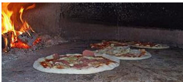
Pizzas dentro de um forno a lenha

Pizza (também grafada piza em Portugal) é uma preparação culinária que consiste em um disco de massa fermentada de farinha de trigo, coberto com molho de tomate e os ingredientes variados que normalmente incluem algum tipo de queijo, carnes preparadas ou defumadas e ervas, normalmente orégano ou manjericão, tudo assado em forno.