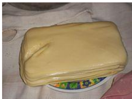
Mozarela fatiada vendida no Brasil.