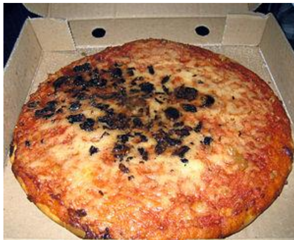
Pizza frita em Glasgow.

Pizza frita (ou deep-fried pizza, em inglês) é um prato da culinária da Escócia.